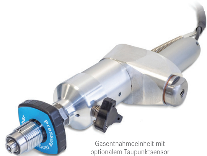
Gasentnahmeeinheit mit optionalem Taupunktsensor