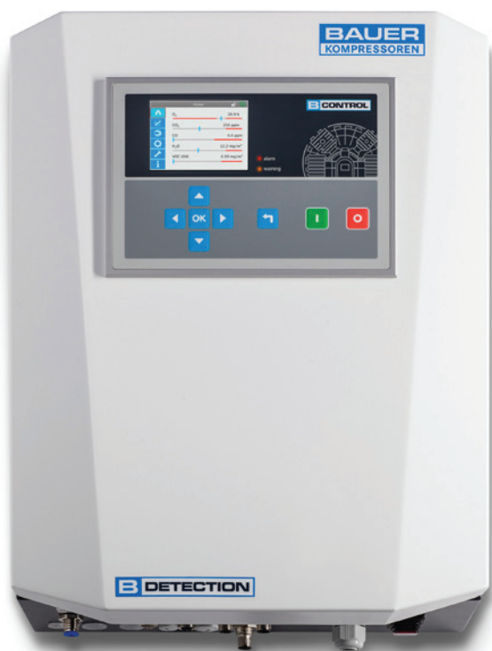
Stand-alone-Version: B-DETECTION PLUS s

Das Online-Gasmesssystem B-DETECTION PLUS überwacht die Qualität der erzeugten Atemluft: Messung von CO, CO 2 , O 2 sowie optional von absoluter Feuchte und Restöl (VOC). 1 Automatisch, ständig und äußerst zuverlässig.