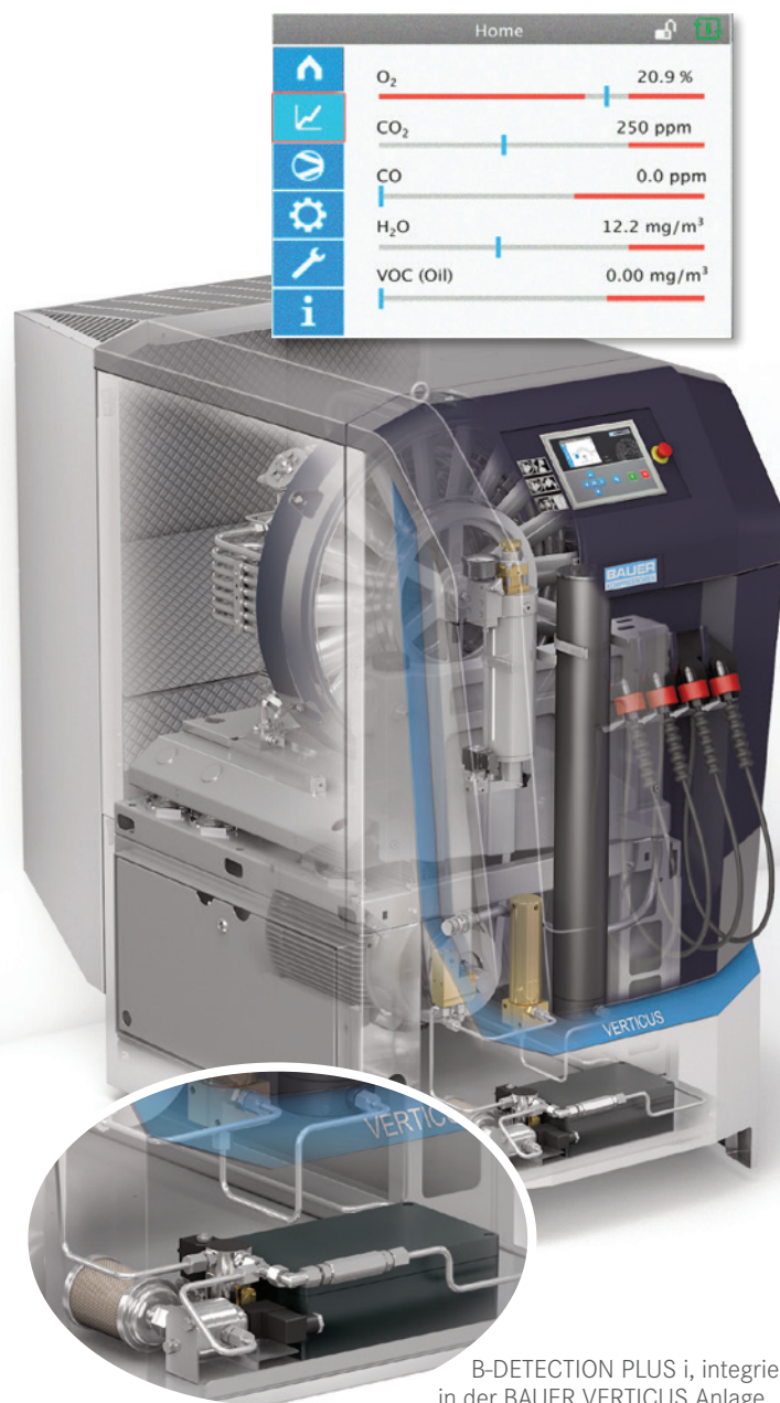
B-DETECTION PLUS i, integriert in der BAUER VERTICUS Anlage