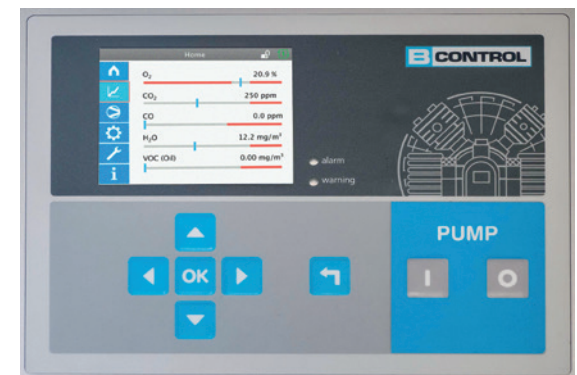
Display mit Grenzwertanzeige nach DIN EN 12021:2014