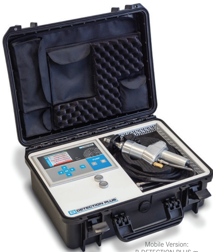
Mobile Version: B-DETECTION PLUS m

Als kompakte, tragbare Kofferlösung gibt B-DETECTION PLUS m Ihnen die Freiheit, zuverlässige Atemluftmessungen durchzuführen, wann und wo Sie möchten.