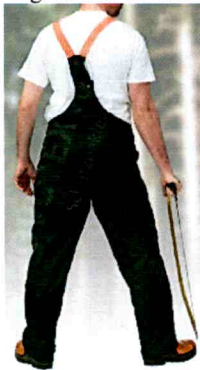
49-123 Form C, Klasse 1. I.H