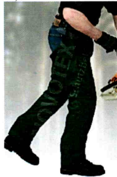
49-160 Form C, Klasse 1, Beinling